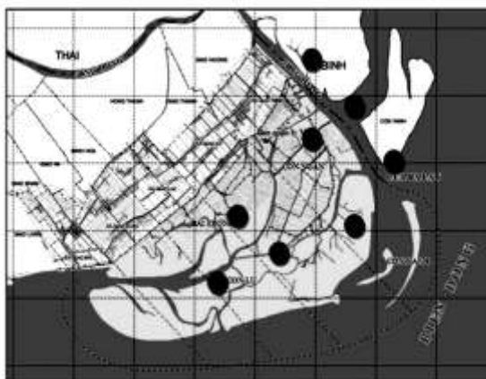
Hình 1. Sơ đồ khu vực khảo sát và nghiên cứu